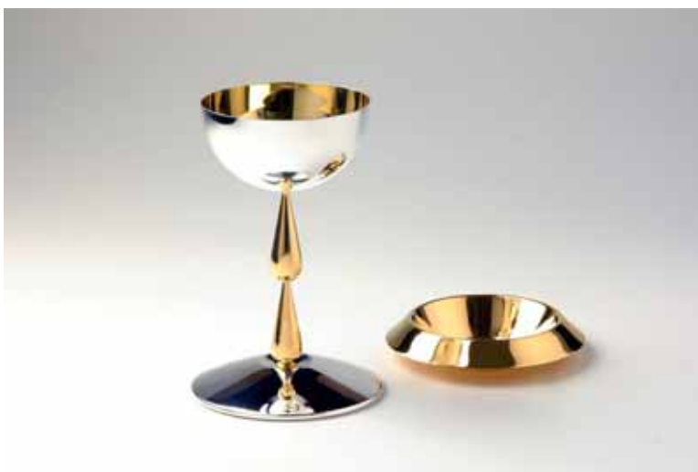
calice e patena progettati da Peppe Di Giuli