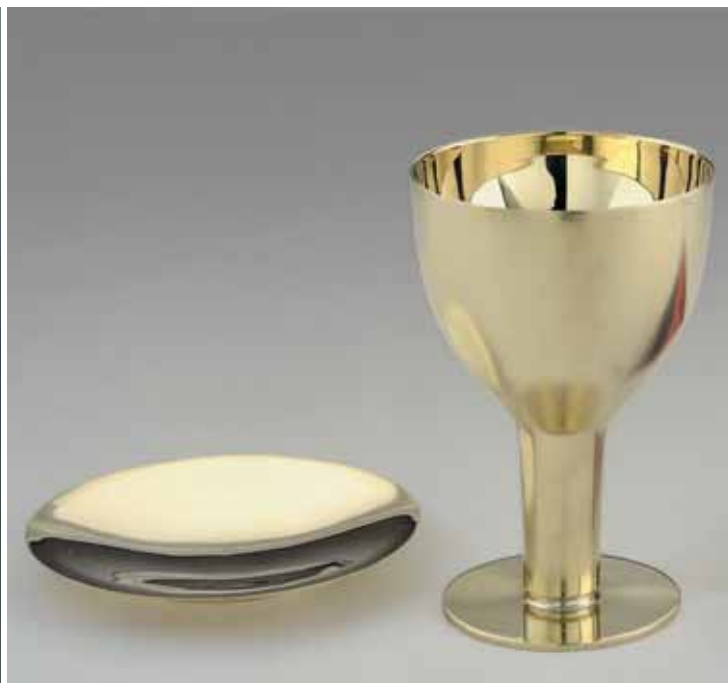
calice e patena progettati da Michele De Lucchi