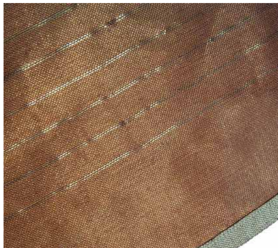
casula realizzata da Marisa Bronzini (dettaglio)