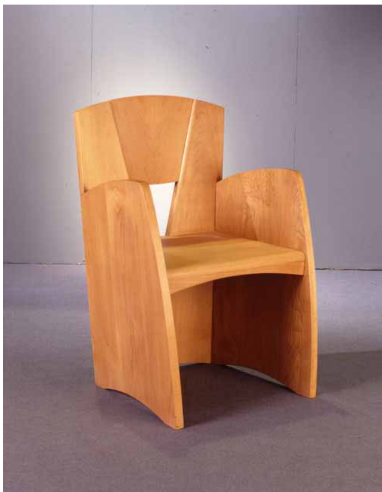
sedia progettata da Paolo Favaretto