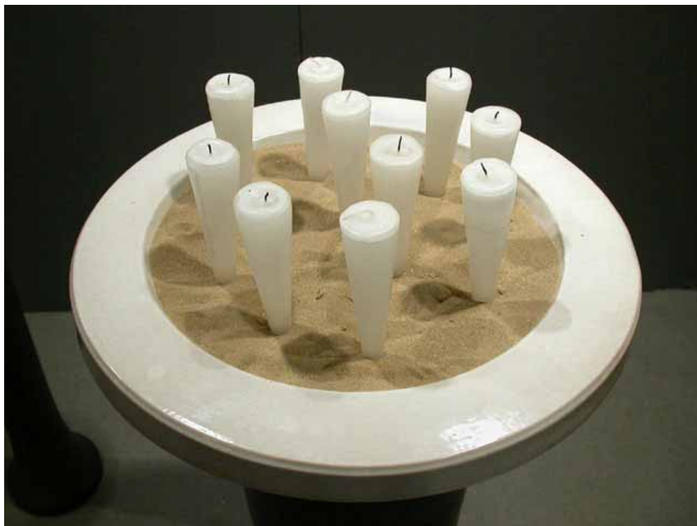
portaceri votivo progettato da Adriano Design (dettaglio)