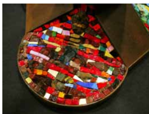
candelabro pasquale realizzato da Francesco Lo Coco e Mario Lo Conte