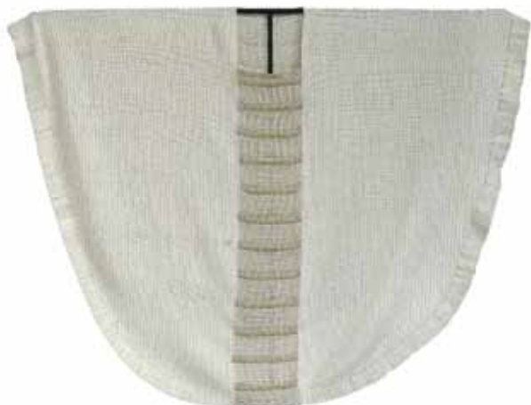
casula realizzata da Maria Varagona