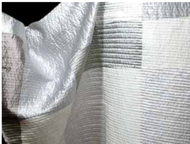
casula progettata da Luca Gori (dettaglio)