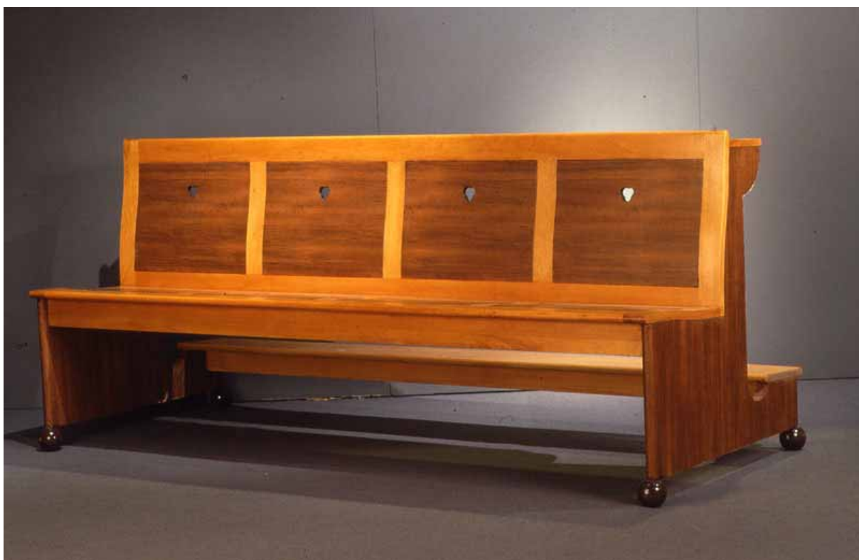
panca progettata da Giotto Stoppino