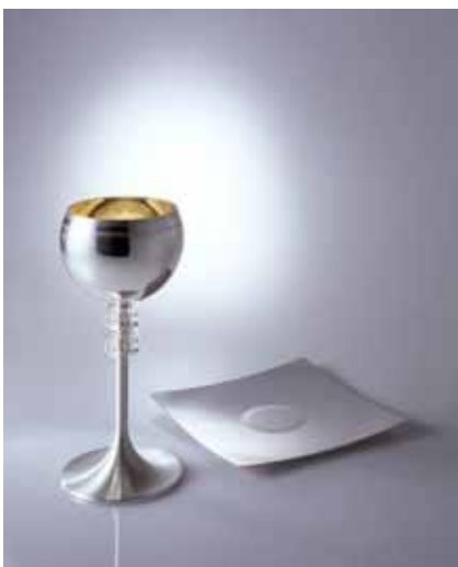
calice e patena progettati da Mario Antonio Arnaboldi