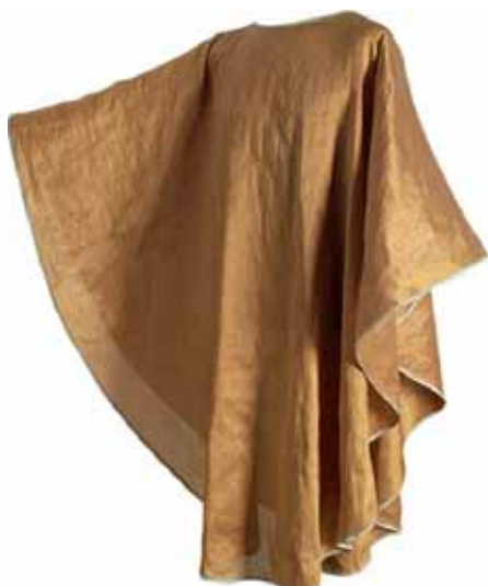
casula realizzata da Marisa Bronzini