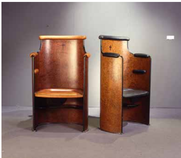
stalli per il coro progettati da Luigi Caccia Dominioni