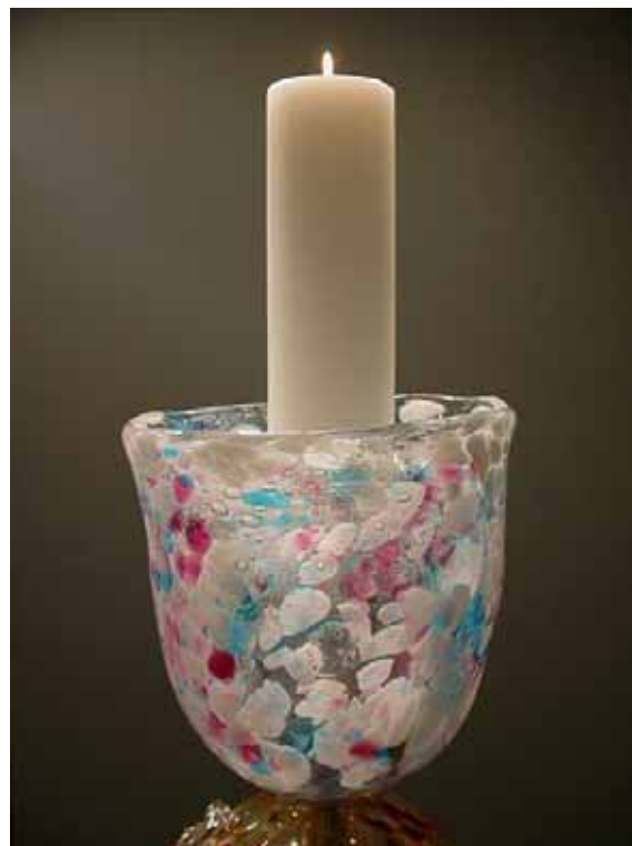
candelabro pasquale realizzato da Sabino Ventura