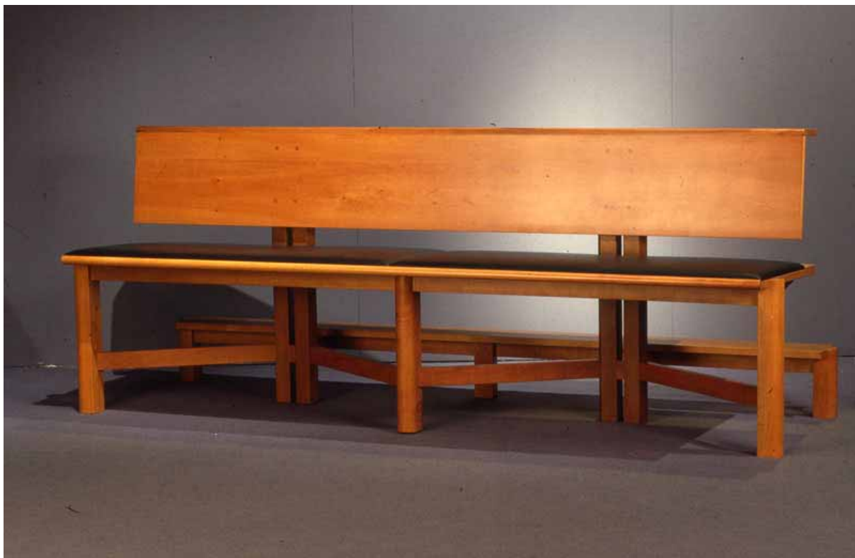
panca progettata da Luigi Di Vito