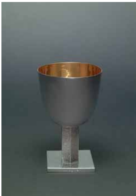
calice progettato da Afra e Tobia Scarpa