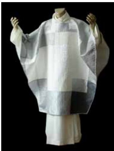
casula progettata da Luca Gori