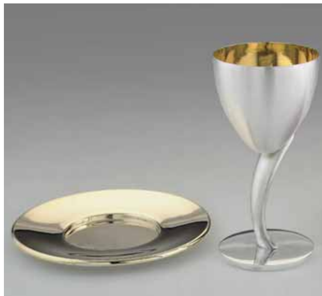
calice e patena progettati da Bruno Gecchelin